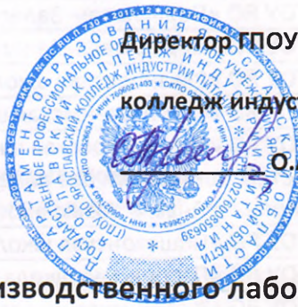
График проведения планового и производственного лабораторного мониторинга в образовательных учреждениях и детских домах Ярославской области на 2021год